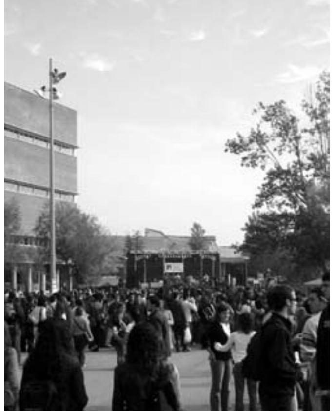
La plaça Cívica de l'Autònoma durant el dia de festa major