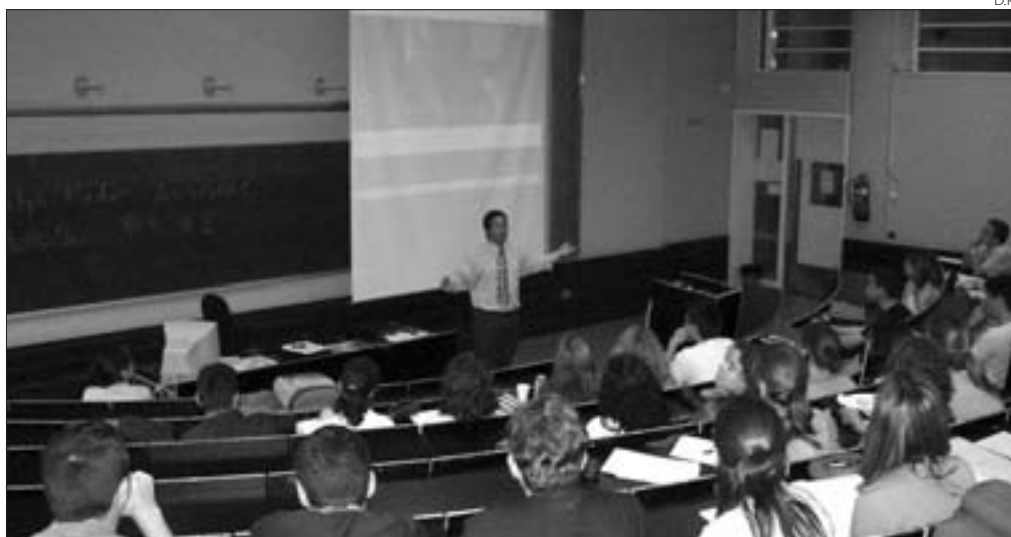
Una imatge d'una aula oberta sobre màrqueting feta el curs 2002-2003