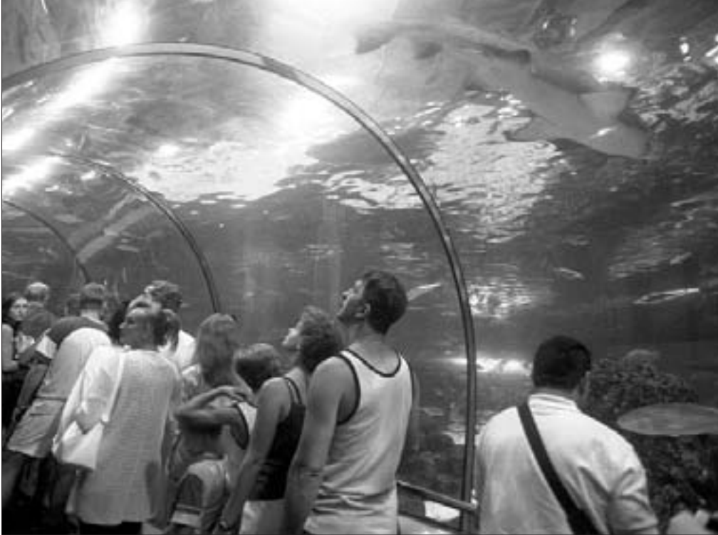
Turistes a un dels passadissos de L'Aquàrium de Barcelona