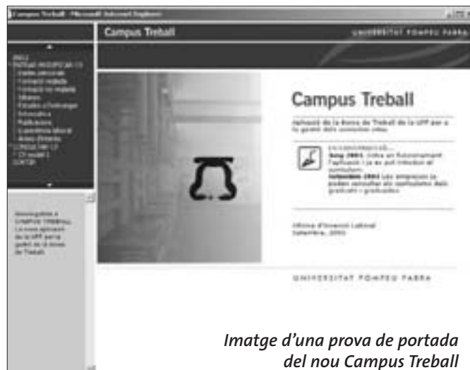
Imatge d'una prova de portada del nou Campus Treball

Campus Treball segueix oferint la possibilitat de publicar a internet els currículums dels graduats (quan un titulat introdueix les seves dades a l'aplicació, l'Oficina d'Inserció Laboral valida el contingut del seu currículum i el publica posteriorment al web de la Universitat). El currículum pot ser actualitzat/modificat per l'interessat sempre que ho desitgi i es pot imprimir –a part dels tres idiomes– en tres